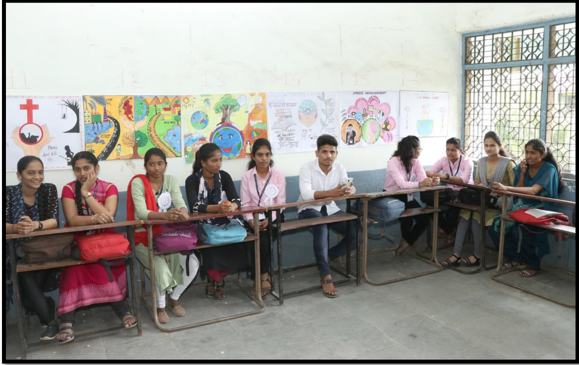
Poster Exhibition by Psychology department